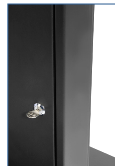
Verrous avec clés

Moderne et élégante, mais aussi robuste, cette borne s'adapte à toutes les applications